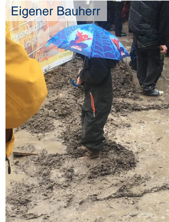
Richtfest Mitte Altona